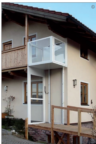
... durch Hublift auch außerhalb