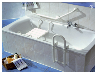
Wanne mit Einstiegshilfen und Sitz