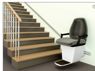
... eine Lösung wird vorgeschlagen