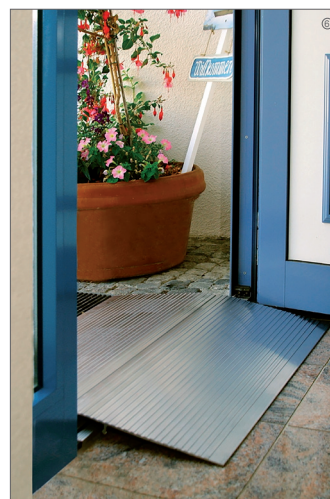
Kleine Lösung – große Wirkung

Möchten Sie Ihre Wohnung so umgestalten, dass Sie trotz eingeschränkter Mobilität selbstbestimmt, sicher und selbständig leben können?