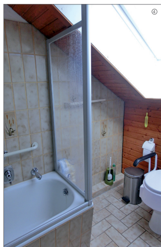
Bad mit Wanne vor dem Umbau