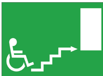
Das Problem ist erkannt ...