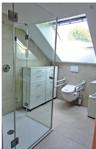
Bad mit Dusche nach dem Umbau