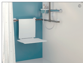
z.B. durch Duschsitz zum Einhängen