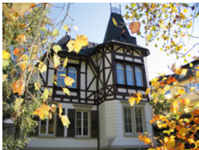
Literaturmuseum im Gartenhaus der Stadtbibliothek

Georg Groddeck war als Arzt und Psychoanalytiker berühmt. Er wurde durch seine psychoanalytischen Schriften und zwei Romane bekannt. In Baden-Baden betrieb er ab 1900 ein Sanatorium, wirkte sozialreformerisch im Konsumverein, der die Gartenstadt-Siedlung Ooswinkel initiierte, und hielt zahlreiche Vorträge.