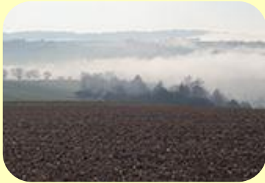
Boden & Grundwasser