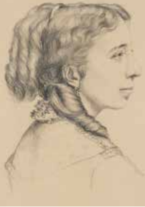
Pauline Viardot Friederike Fedoroff (um 1935)