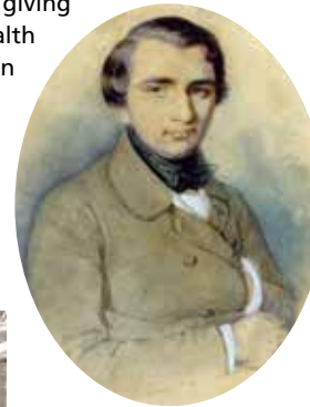
Ivan Turgenev Kirill Gorbunov (1838)

The exhibition is a collaborative project between the city Baden-Baden (Stadtbibliothek and Stadtmuseum) and the University of Freiburg. Besides giving instructive information and a wealth of visual material, the exhibition also includes two films produced especially for it, various digital resources, audio stations, literature to browse and much more.