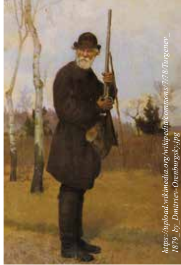
Turgenev im Jagdanzug Nikolaj Dmitriev-Orenburgskij (1879)

https://upload.wikimedia.org/wikipedia/commons/7/78/Turgenev_1879_by_Dmitriev-Orenburgskij.jpg