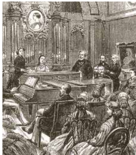
Matinee in der Orgelhalle der Villa Viardot in Baden-Baden Ludwig Pietsch (1865)

https://upload.wikimedia.org/wikipedia/commons/e/e4/Turgenev_1838_by_Gorbunov.jpg